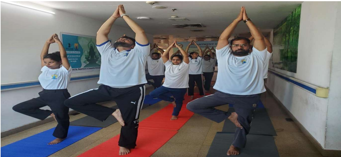
अंतरराष्ट्रीय योग दिवस समारोह