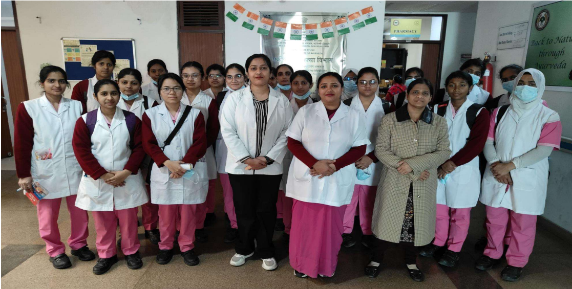
राजकुमारी अमृत कौर नर्सिंग कॉलेज के शैक्षणिक भ्रमण