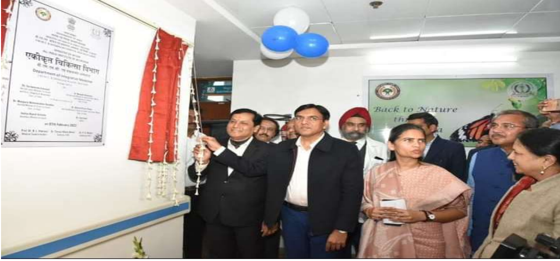
एकीकृत चिकित्सा विभाग उद्घाटन